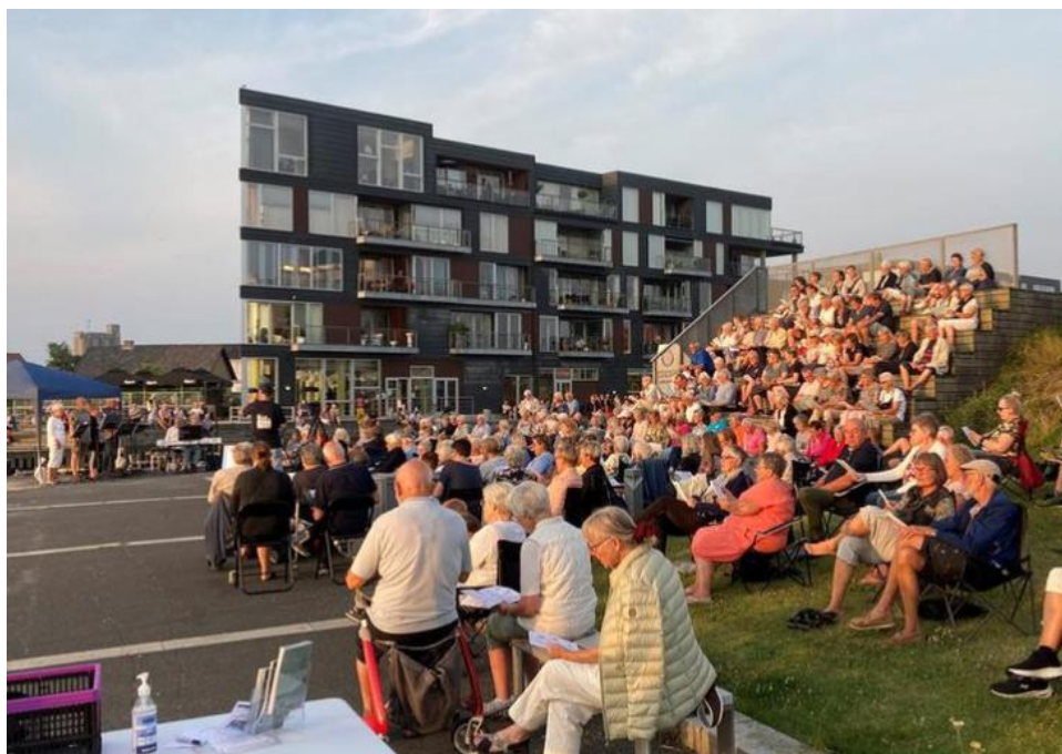
Fra syng solen ned, slotsbryggen i juli og august måned 2021